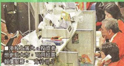
■港股上落大，投資者想更貼貼大市，可用股票報價服務。

綜合6家報價商的「任上」串流報價月費計劃（見表），當中最貴為滙港資訊（infocast），月收637元，但如客戶選擇預繳，部份報價商會給予折扣，如經濟通月費本為462元，如客戶預繳一年費用，只需4334元，平均每月362元。不過價錢仍不及滙訊數碼低，折後每月僅331.2元。